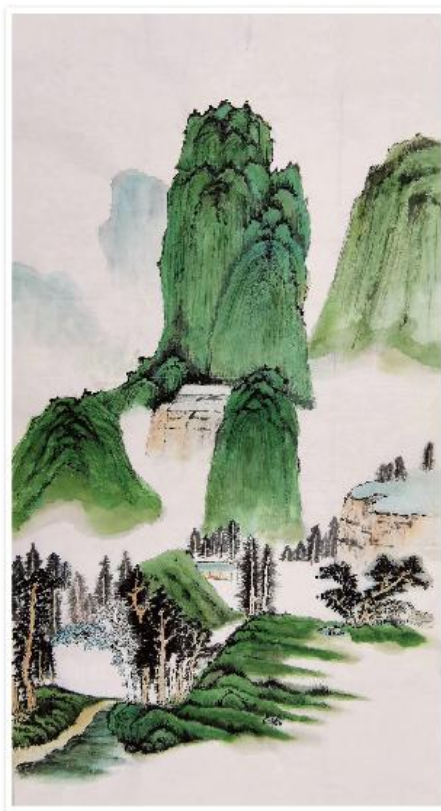
《青山》 “山东德运”轮 马晓辉