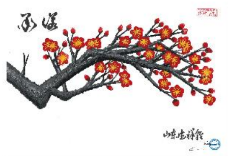
《承诺》 “山东德祥”轮 李刚科